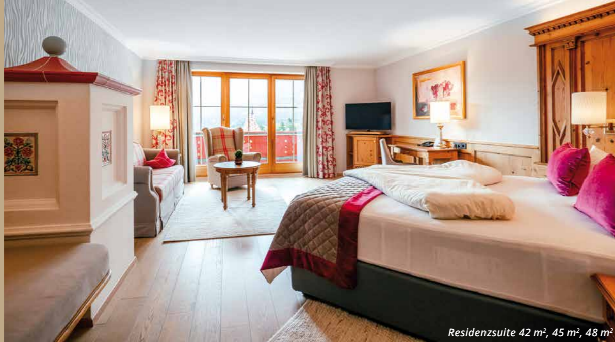
Residenzsuite 42 m 2 , 45 m 2 , 48 m 2

Finden Sie Ruhe, Erholung und tanken Sie neue Lebenskraft in unseren kuscheligen Zimmern und luxuriösen Suiten.