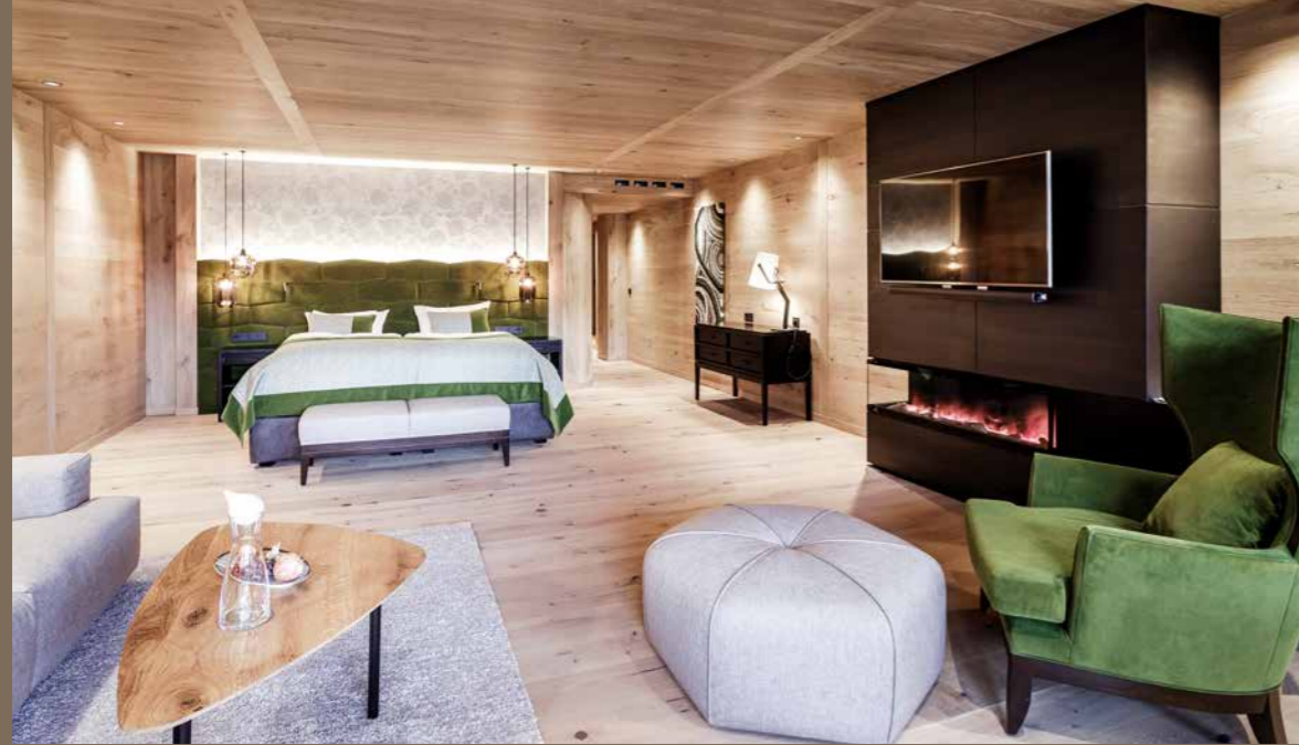
Viel Raum zum Entfalten und Entspannen bieten die großzügigen Wohlfühlsuiten in der Cocoon – Alpine Boutique Lodge inklusive Private Spa.