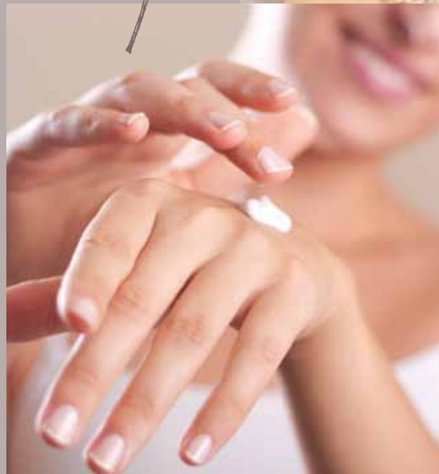
- HÄNDE & FÜSSE -