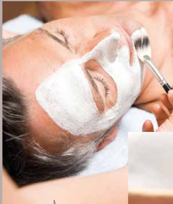
- GESICHT -