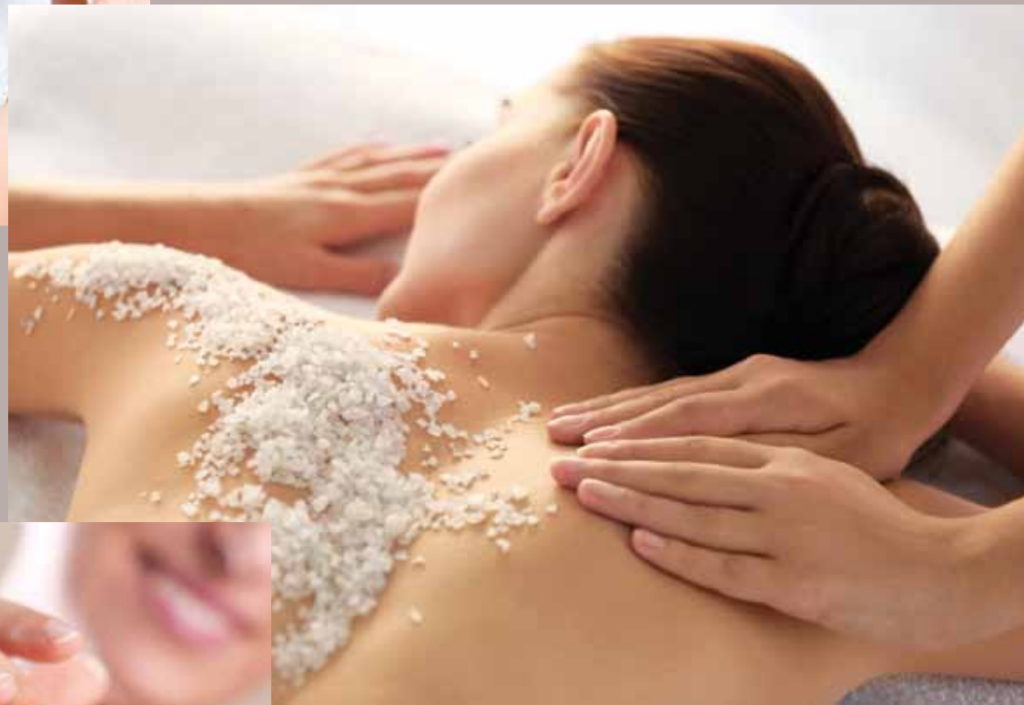
- KÖRPER -