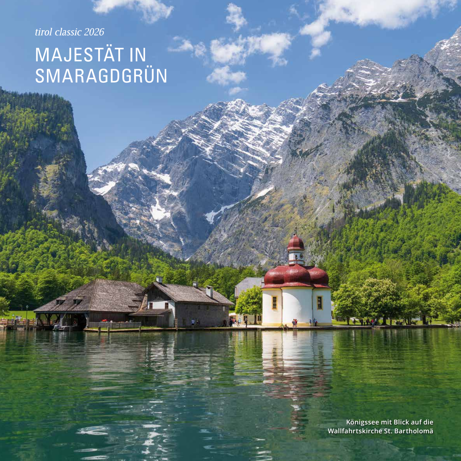
Königssee mit Blick auf die Wallfahrtskirche St. Bartholomä