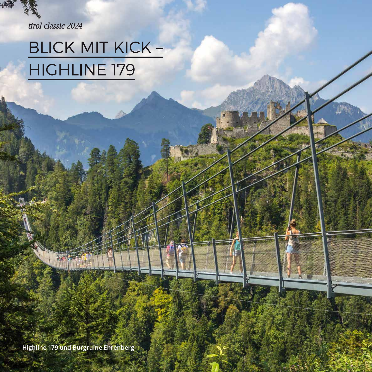
Highline 179 und Burgruine Ehrenberg